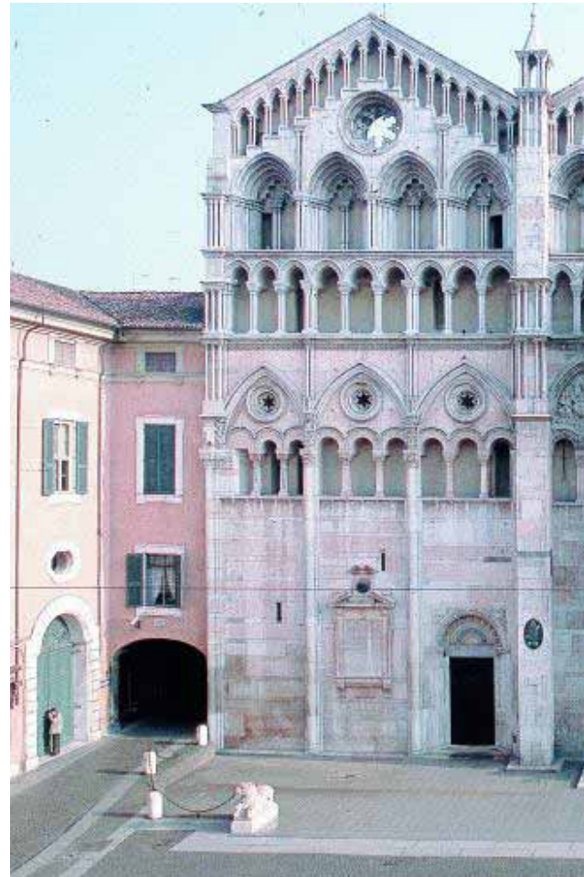
Majestuosa iglesia. La Catedral de Ferrara fue construida entre los siglos

Posee uno de los pocos campos europeos de golf ubicados en el centro histórico de una ciudad