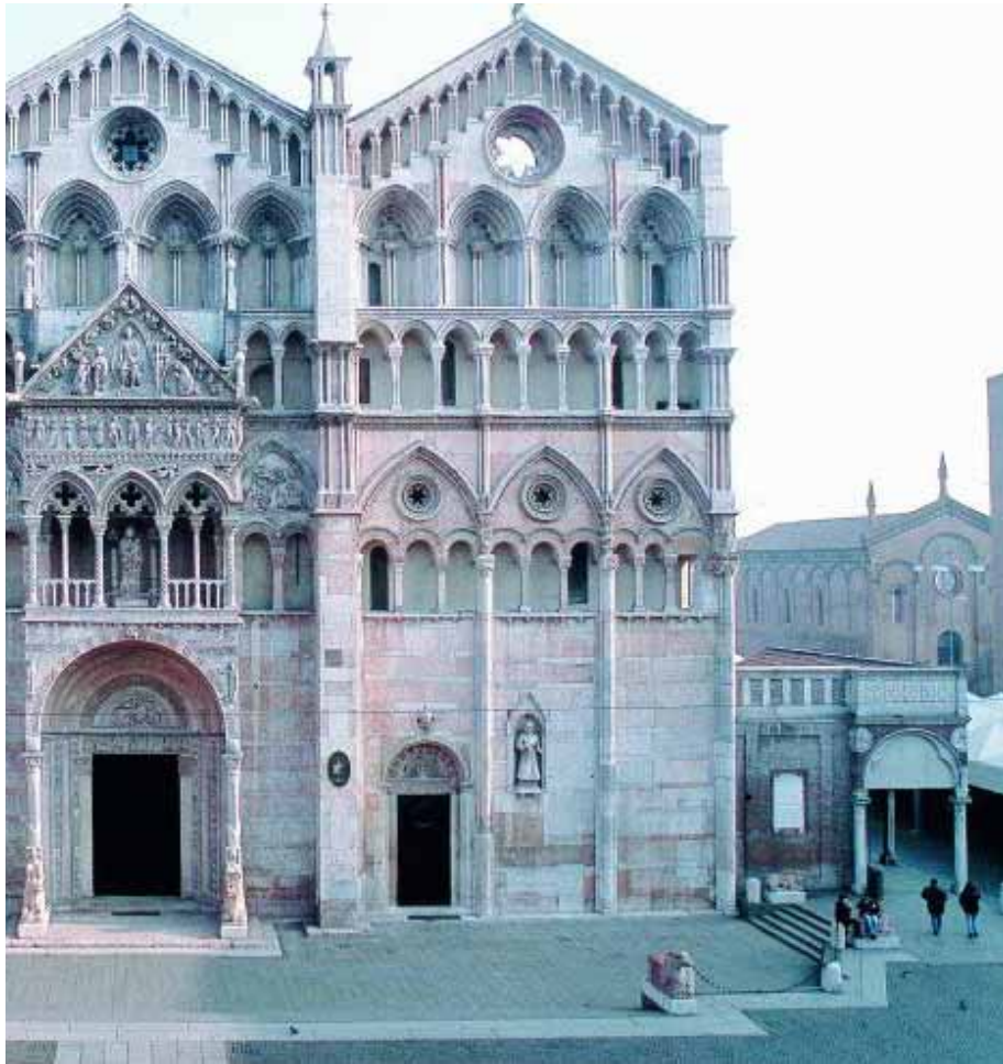
XII y XIV. :: F. P.