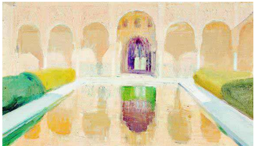
Patio de Comares. Una de las obras de Sorolla que formará parte de la colección.

La exposición se abrirá con una importante colección de retratos de familia del pintor en el marco de jardines con fuentes: obras maestras como María vestida de campesina valenciana, jugando a saltar la