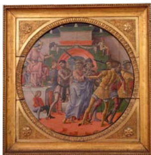
El Juicio de San Mauro , Cosmè Tura

La primera sala alberga la Colección Vendeghini Baldi, con obras como la Adoración de los magos de Jacopo y Giovanni Bellini, una Virgen y un San Petronio de Ercole de' Roberti y un