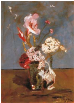
El Gladiolo fulminado, F. De Pisis