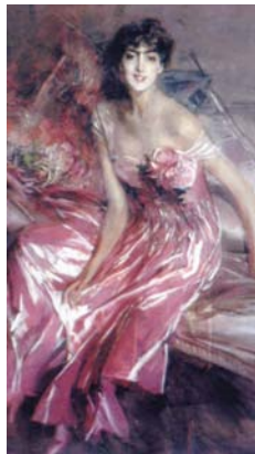
La Señora de Rosa, G. Boldini

cuentran obras de Mario Sironi, Aroldo Bonzagni, Achille Funi e Roberto Melli. La segunda mitad del Museo está dedicada a Filippo de Pisis (1896-1956). Artista muy original, poeta y pintor, en todas sus obras se puede apreciar un tipo de melancolía crepuscular junta a la búsqueda de una dimensión cósmica. Sus colores son inconfundibles, con tonalidad pastel, a veces oscuros otras son manchas vivas. Muchas son las naturalezas muertas, tema a él muy caro donde se puede leer la influencia de